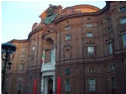
Palazzo Carignano, de style baroque piémontais

les souverains ayant fait appel aux plus grands artistes de leur temps pour affirmer leur prestige: le baroque Guarino Guarini et l'élégance typiquement dix-huitième de Filippo Juvarra ont laissé des témoignages admirables dans la ville et dans ses environs.