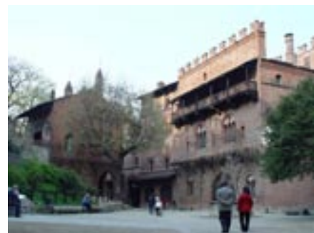
Bourg médiéval du Valentino

Pour découvrir tous ces trésors, la ville a créé l' "Abbonamento Musei Torino Piemonte" qui permet de visiter 150 musées, Résidences Royales, châteaux, jardins et forteresses dans la ville et aux alentours.