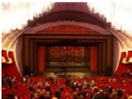
Le théâtre "Regio"

Le nouveau théâtre pouvait accueillir 2.500 spectateurs et sa salle était considérée la plus grandiose d'Europe. Les grands noms du chant et du ballet ont foulé les planches du Regio.