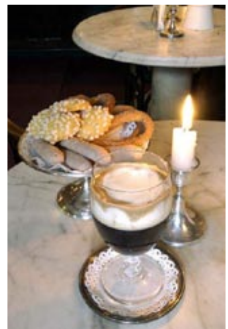
Le Bicerin, boisson emblématique

Turin renferme d'incalculables trésors d'art et d'architecture. L'architecture baroque en particulier a connu ses plus belles réalisations à l'époque de la Maison de Savoie,