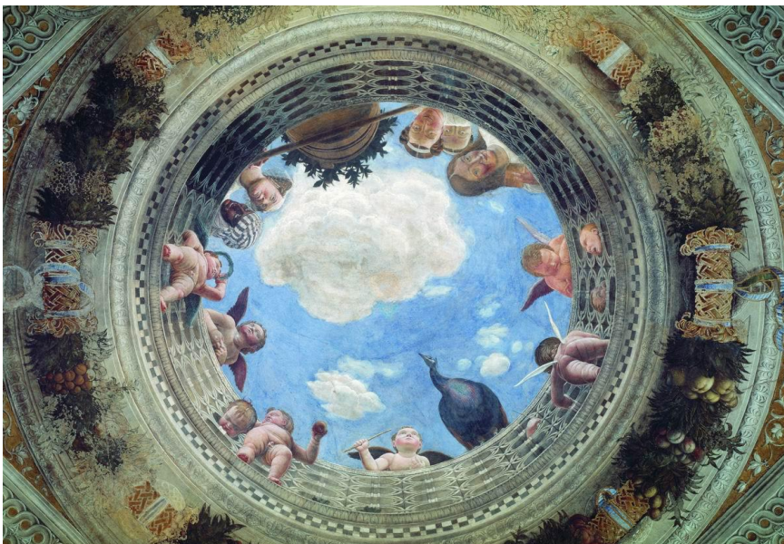
La Chambre des Epoux, 1465-1474, Palais ducal de Mantoue

Sa grande œuvre demeure la Chambre des Epoux réalisée au Palais ducal de Mantoue, fresques à la gloire du duc de Gonzague et de sa famille, chef d'œuvre de réalisme et de trompe l'œil.