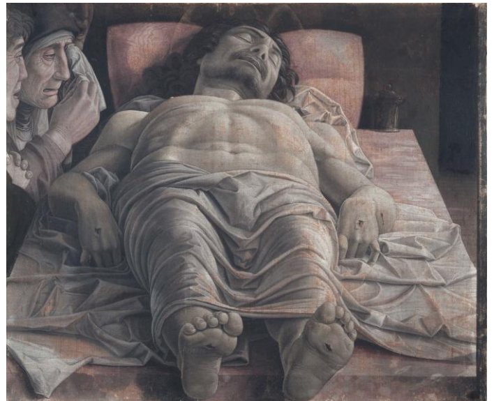
La lamentation sur le Christ mort, c 1475, Milan

Andrea Mantegna (1431-1506) est l'un des plus grands artistes de la seconde génération des peintres du Quattrocento, actif à Padoue et à la cour ducal de Mantoue. Jeune homme doué et précoce, il s'affirme rapidement comme le peintre de la tension et du mouvement, par un style nerveux et expressif, virtuose dans la représentation de la perspective et dans le rendu des personnages et des scènes en contre-plongée (Chapelle Ovetari à Padoue). Passionné de l'Antiquité dont il proposa une vision nouvelle et érudite (les Triomphes de César), il fut aussi un dessinateur et un graveur remarquable. Au fait des nouveautés flamandes et toscanes, il noua avec son beau-frère Giovanni Bellini un dialogue très intense dont témoignent leurs œuvres de jeunesse stylistiquement proches.