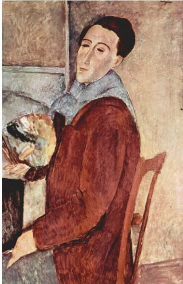
Autoportrait, 1919 Sao Paulo

Amédéo Modigliani (1884-1920) est un artiste unique. A lui seul, il symbolise la bohème parisienne. On reconnaît instantanément ses tableaux grâce à la douce poésie avec laquelle il représente ses modèles : allure gracile, visage allongé et regard sans pupille.