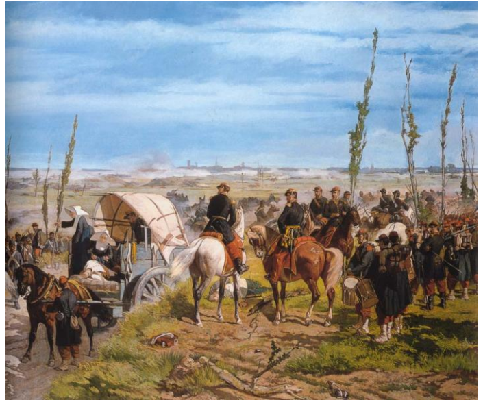
Giovanni Fattori, 1861, Le Camp italien après la bataille de Magenta, Galerie d'Art moderne de Florence

Au même moment, en France, en forêt de Fontainebleau, des artistes se retrouvent pour peindre sur le motif, à la recherche de sujets réalistes proches de la nature. Un peu plus tard, les Impressionnistes révolutionnent l'art du paysage avec des couleurs vibrantes. Certains liens les unissent, d'autres les opposent.