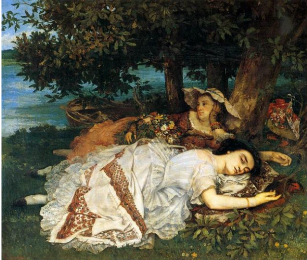
Gustave Courbet, Les Demoiselles des bords de la Seine, 1856, Paris, Petit Palais

À Florence, vers 1850, des peintres, les Macchiaioli, conçoivent une peinture novatrice qui s'oppose à la peinture académique. Ils recherchent un rapport plus direct avec leur environnement et préconisent la peinture en plein air. Ils utilisent les couleurs vives avec beaucoup de liberté et privilégient les contrastes intenses entre l'ombre et la lumière.