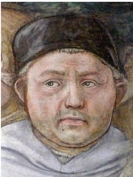
Détail autoportrait, fresque de la Vie de la vierge , 1467-69, Duomo de Spoleto.

Filippo Lippi (Florence 1406- Spolète 1469) est l'un des grands peintres de la première génération des artistes du Quattrocento, pourtant moins connu de nos jours que Fra Angelico ou Piero della Francesca.