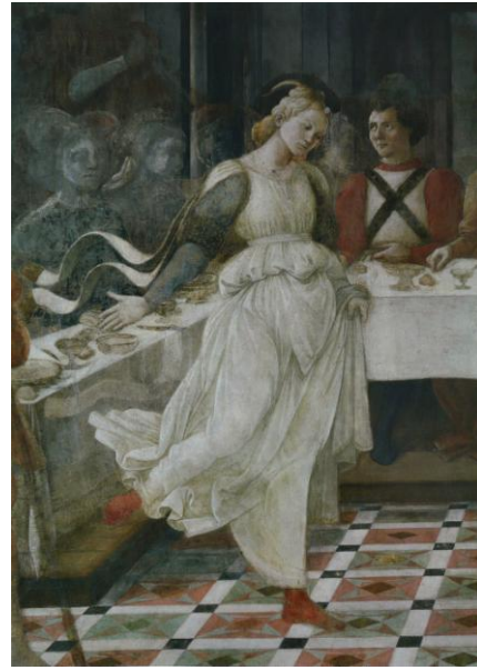
Détail Danse de Salomé , fresque du Banquet d'Hérode , c 1452-65, duomo de Prato.