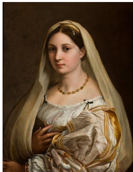
La Velata, 1512-1516, Palais Pitti

Raphaël fut également nommé architecte de la basilique Saint Pierre en 1514 à la mort de Bramante son protecteur, et conservateur des Antiquités romaines. Seulement, épuisé par toutes ces tâches, il meurt à 37 ans en pleine gloire. Pour des générations de peintres, jusqu'à Ingres, Delacroix et Picasso, il est le peintre par excellence de la grâce et du beau harmonieux.