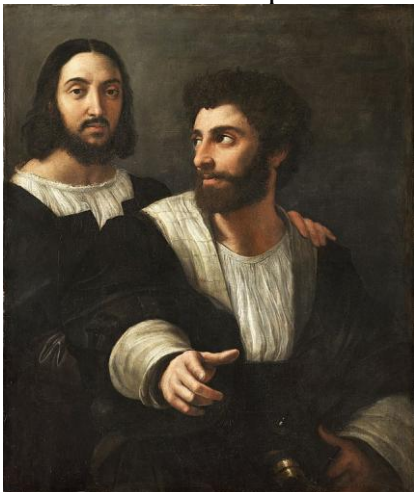
Autoportrait avec un ami, 1518, Louvre

Raffaello Sanzio (Urbino 1483 – Rome 1520) fit son apprentissage à Pérouse auprès du Pérugin, puis à Florence où il peignit ses premières Madones sous l'influence conjointe de Léonard de Vinci et de Michel-Ange. C'est à Rome, dès 1508, qu'il donne la pleine mesure de son talent : à la demande du pape Jules II, il décore les Stanze du Vatican, dont le succès lui vaut la commande de la décoration de la villa Farnésine ; puis il déploie une activité encore plus intense sous le règne de Léon X, exécutant ses plus belles Madones et ses plus beaux portraits.