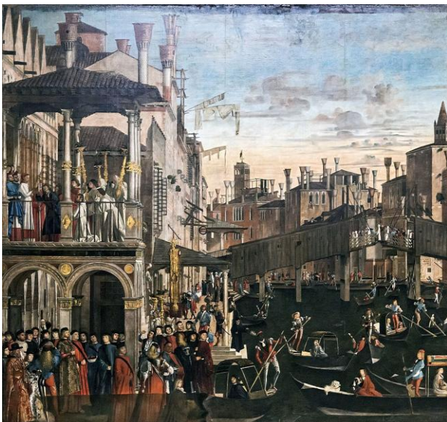
Le Miracle de la relique de la Croix au Pont du Rialto, 1496, Gallerie dell'Accademia de Venise.

Vittore Carpaccio (1460-1526) est un peintre narratif qui occupe une place un peu marginale dans l'art de la Renaissance. Il est surtout connu pour les cycles picturaux qu'il réalise pour les scuole, ces puissantes corporations vénitienne.