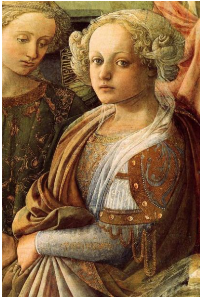
Détail Couronnement de la vierge , c 1441-47, Offices