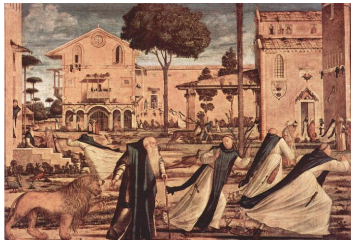
Saint Jérôme conduisant au monastère le lion blessé, 1502 Scuola di San Giorgio degli Schiavoni, Venise

Grâce à un sens de l'espace unique pour l'époque qui s'appuie sur une parfaite maîtrise de la perspective, il est l'un des premiers peintres à intégrer l'architecture dans ses tableaux. Ainsi, il s'impose comme un grand peintre de paysages urbains, précurseur du genre que l'on appellera plus tard veduta. Ces scènes dévoilent une Venise florissante, puissante et prospère, baignée dans une lumière douce et dorée.