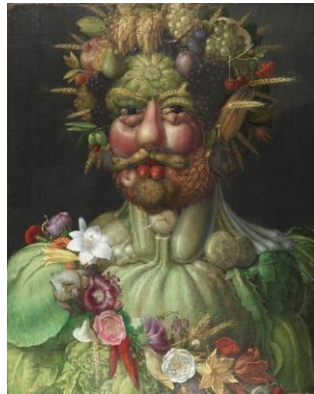
Vertumne (Rodolphe II), Giuseppe Arcimboldo, 1591

Au-delà de l'espace dans lequel évoluaient les Grands du royaume où l'architecture et le paysage étaient des éléments démonstratifs de leur puissance, cette période de changements a également impacté leurs comportements alimentaires et ce qu'on appelle l'art de la table.