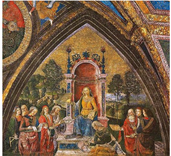
Vatican. Appartements Borgia, la Géométrie

Comment les membres de cette obscure famille espagnole ont-ils pu se hisser au plus haut de la hiérarchie sociale, atteindre une célébrité qui fascine le grand public et stimule encore aujourd'hui la création artistique ?