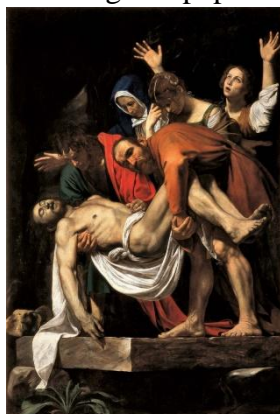
Déposition 1602- 1604 Rome Musées du Vatican

La puissance de son art qui contraste avec la peinture affectée de ses contemporains éblouit par son sens de la composition, sa maîtrise du clair-obscur et le réalisme parfois dérangeant de ses modèles souvent issus des bas-fonds de la société.