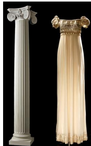
Gianfranco Ferré pour Dior, Robe Palladio, collection « Au vent de l'été » Haute Couture Printemps-Été, 1992

Ainsi, il existe des inspirations de Fra Angelico dans les modèles de Jeanne Lanvin, une réinterprétation du baldaquin du Bernin dans les robes de Giovanni Versace ou encore des corrélations entre des tableaux de Raphaël et des robes de Christian Lacroix.