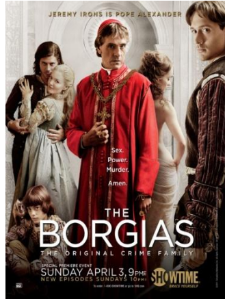
Série TV, Les Borgia