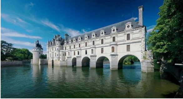
Château de Chenonceau

La Renaissance est née en Italie à la fin du 14 e siècle par le biais d'un nouveau courant de pensée: le monde se conçoit désormais en y plaçant l'Homme en son centre. Devenue un foyer de rayonnement partout en Europe, la Renaissance italienne, exaltant le retour à la culture de l'Antiquité classique (gréco-romaine), a atteint le royaume de France un siècle et demi plus tard.