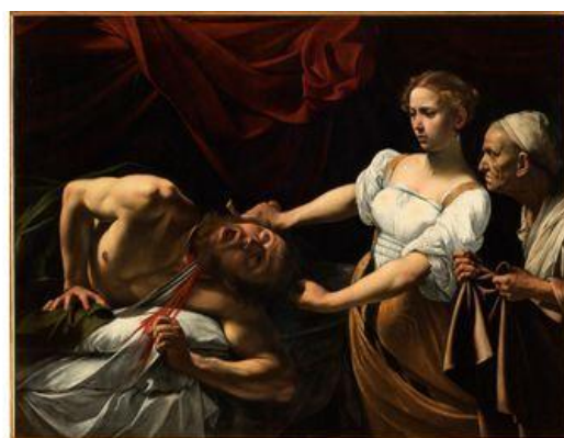
Judith et Holopherne v.1599-1600, Rome Palais Barberini

Né à Milan en 1571, il arrive à Rome en 1592 où, après avoir connu la misère, il devient le protégé du Cardinal Del Monte ce qui lui permet de toucher un large public de hauts dignitaires ecclésiastiques ainsi qu'une riche clientèle privée. Mais, en pleine gloire, il est condamné à mort pour homicide et doit fuir à Naples, puis à Malte, en Sicile, et de nouveau à Naples. Il meurt prématurément, en 1610, alors qu'il tentait de revenir à Rome pour obtenir la grâce papale.