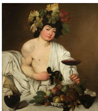
Bacchus v. 1597, Florence Musée des Offices