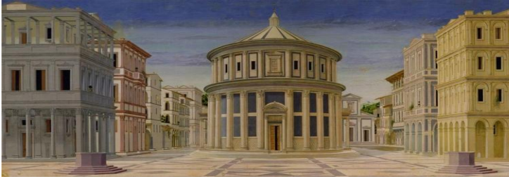
La città ideale , école Piero della Francesca ou Luciano Laurana, musée national des Marches

Urbino, bâtie en briques roses sur deux collines dans la région des Marches, a été régie par la famille des Montefeltro dès le 12 ème siècle. C'est au 15 ème siècle qu'elle connut son apogée et fut l'un des pôles artistiques, militaires et scientifiques les plus importants de la Renaissance italienne. Ville natale du peintre Raphaël, cette cité fut le siège d'une cour raffinée sous l'impulsion du duc Federico qui reçut de nombreux artistes tels que Piero della Francesca, Paolo Ucello ou le Pérugin.