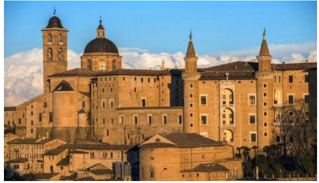
Palais ducal d'Urbino construit entre 1444 et 1472

C'est l'histoire d'une ville façonnée par un condottiere devenu prince humaniste à l'époque de Laurent le Magnifique ; Federico de Montefeltro. Il donna vie au 15 ème siècle à une « ville en forme de palais ».