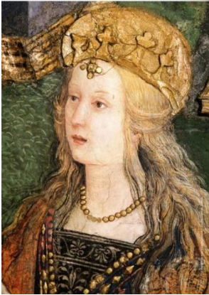
Vatican. Pinturicchio, Lucrèce Borgia en Sainte Catherine d'Alexandrie

Depuis le XV ème siècle les membres de la famille Borgia ont fait couler beaucoup d'encre, en particulier, trois de ses membres : le pape Alexandre VI et deux de ses enfants, César et Lucrèce. Si leurs noms sont associés aux pires turpitudes, aux crimes les plus abominables, on doit toutefois leur reconnaître de réelles qualités d'audace, de courage, un grand sens politique dans une époque tourmentée où les profondes mutations religieuses, économiques et culturelles ont fait basculer l'Occident du monde médiéval aux Temps modernes.