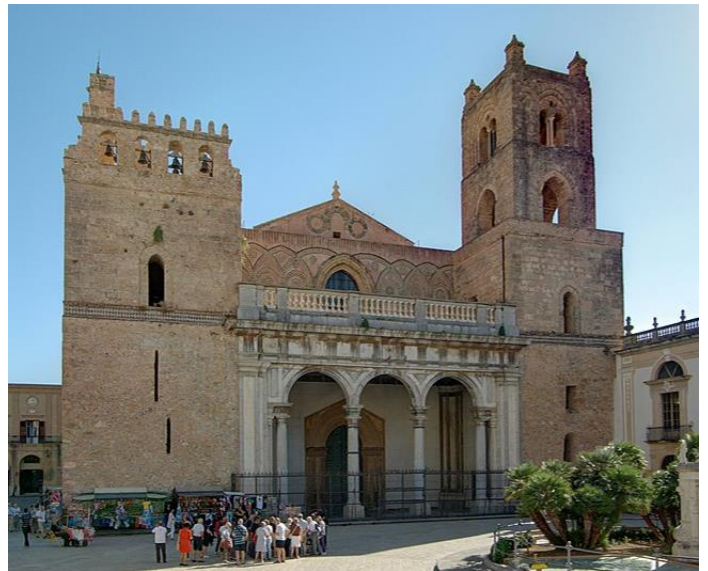
Cathédrale de Cefalù (Sicile-Italie)

Les rois normands feront construire des palais somptueux décorés de marbres et de mosaïques, des forteresses, des monastères, des églises, parfois sur d'anciens temples grecs ou d'anciennes mosquées comme San Giovanni Degli Eremiti à Palerme. Ces édifices religieux s'inspirent souvent de l'art byzantin, mozarabe mais aussi, à Cefalù et Monreale, de l'art romano-normand.