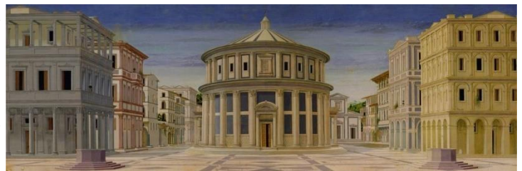
La città ideale, école Piero della Francesca ou Luciano Laurana musée national des Marches

Urbino, bâtie en briques roses sur deux collines dans la région des Marches, a été régie par la famille des Montefeltro dès le 12 ème siècle. C'est au 15 ème siècle qu'elle connut son apogée et fut l'un des pôles artistiques, militaires et scientifiques les plus importants de la Renaissance italienne. Ville natale du peintre Raphaël, cette cité fut le siège d'une cour raffinée sous l'impulsion du duc Federico qui reçut de nombreux artistes tels que Piero della Francesca, Paolo Ucello ou le Pérugin.