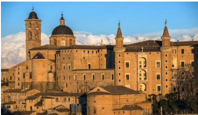
Palais ducal d'Urbino construit entre 1444 et 1472

C'est l'histoire d'une ville façonnée par un condottiere devenu prince humaniste à l'époque de Laurent le Magnifique ; Federico de Montefeltro. Il donna vie au 15 ème siècle à une « ville en forme de palais ».