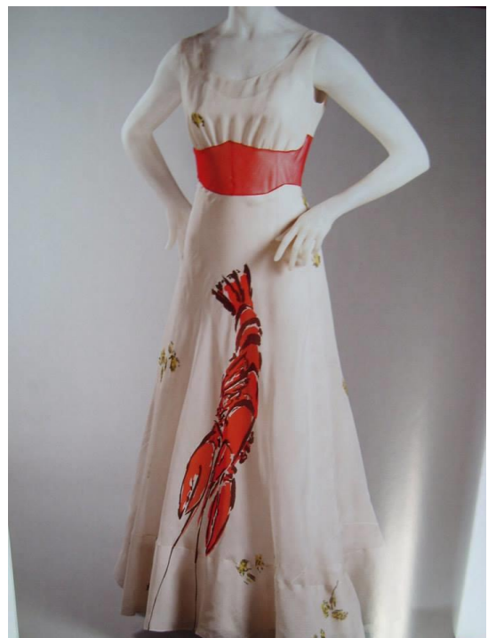
Robe d'Elsa Schiaparelli

Elsa Schiaparelli, est une couturière qui a révolutionné la mode du XXème siècle. Elle est connue pour être à l'origine des sweaters (petits pulls en maille) et pour ses nombreuses collaborations avec les artistes de son temps, dont le plus célèbre: Salvador Dali. La conférence présenterait ses créations les plus importantes et leur impact dans l'histoire de la mode, ainsi que ses différentes collaborations artistiques.