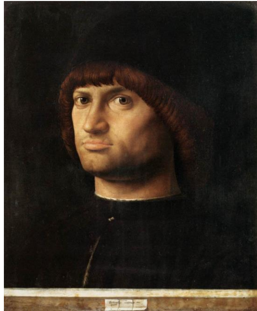
Antonello de Messine, Le Condottiere.

Les échanges entre les deux cultures furent considérables et l'on ne peut comprendre pleinement la peinture du Quattrocento italien sans l'apport des Flamands, sans le réalisme révolutionnaire de la peinture flamande à l'huile, dont les Italiens, peintres, marchands et collectionneurs vont s'enticher, pour ensuite l'imiter et l'acheter.