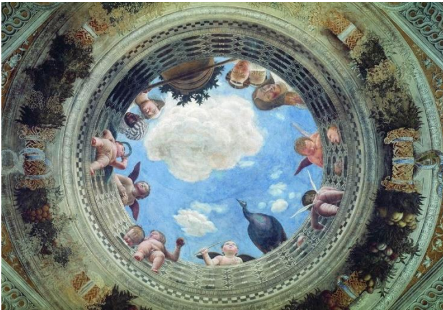
La Chambre des Epoux, 1465-1474, Palais ducal de Mantoue

Sa grande œuvre demeure la Chambre des Epoux réalisée au Palais ducal de Mantoue, fresques à la gloire du duc de Gonzague et de sa famille, chef d'œuvre de réalisme et de trompe l'œil.