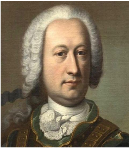
Portrait du marquis de Sade