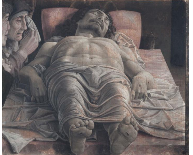
La lamentation sur le Christ mort, c 1475, Milan

Passionné de l'Antiquité dont il proposa une vision nouvelle et érudite (les Triomphes de César), il fut aussi un dessinateur et un graveur remarquable. Au fait des nouveautés flamandes et toscanes, il noua avec son beau-frère Giovanni Bellini un dialogue très intense dont témoignent leurs œuvres de jeunesse stylistiquement proches.