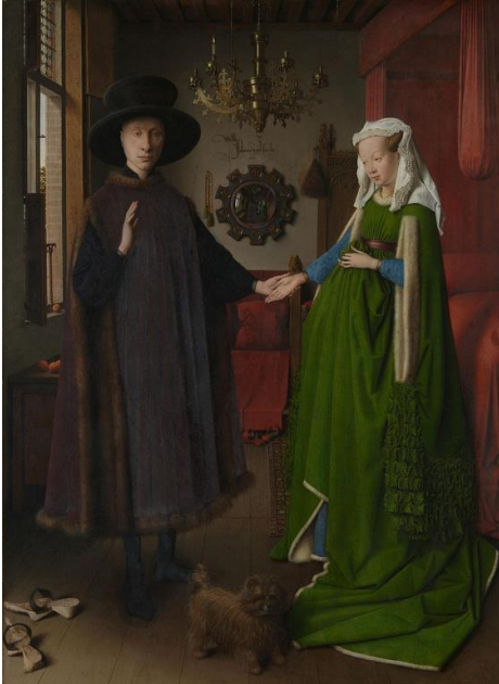
Jan van Eyck, Le Portrait des époux Arnolfini

Entre 1420 et 1440, un art nouveau par son réalisme naît simultanément dans les Flandres bourguignonnes et en Italie, qualifié sur le sol italien de « renaissant », et d'ars nova dans le duché de Bourgogne.