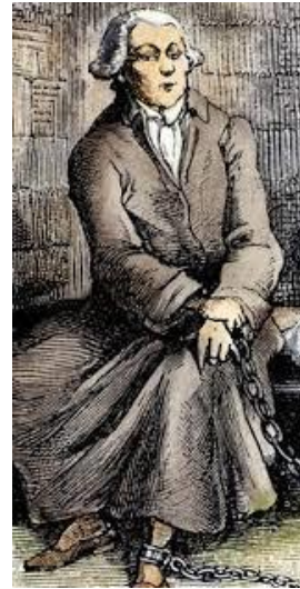
Le marquis à la Bastille

Sade enfermé à la Bastille, ses papiers, notes de voyage, et cette collection de dessins sont saisis, puis miraculeusement survécus aux guerres et prisons. Conservé par sa descendance établie en Touraine, des expositions eurent lieu à Paris à Nissim Camondo, Avignon au musée Clavet, Tours à la bibliothèque, et enfin à Rome au Palais Farnèse.